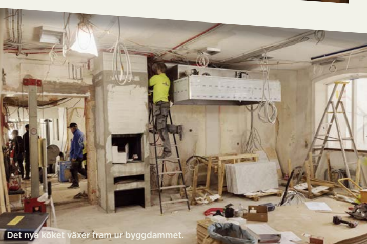
Det nya köket växer fram ur byggdammet.