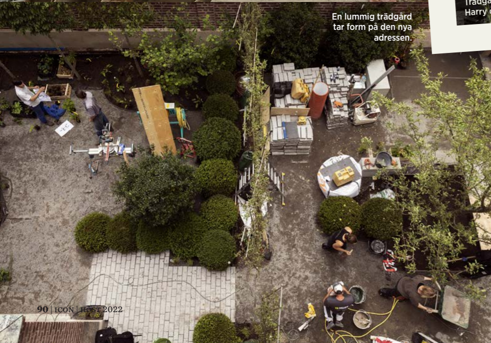
En lummig trädgård tar form på den nya adressen.