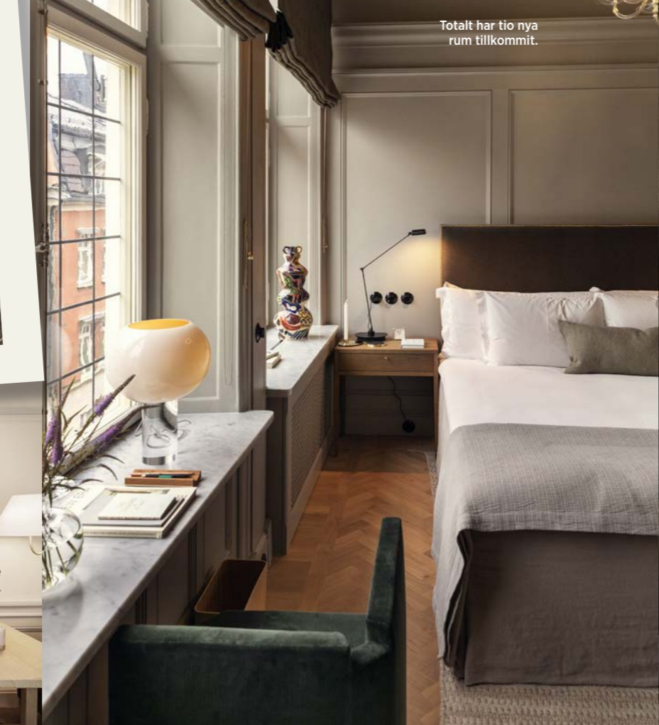
Totalt har tio nya rum tillkommit.