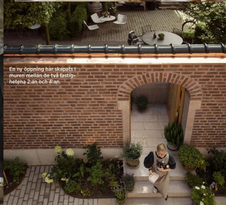
En ny öppning har skapats i muren mellan de två fastigheterna 2:an och 4:an.