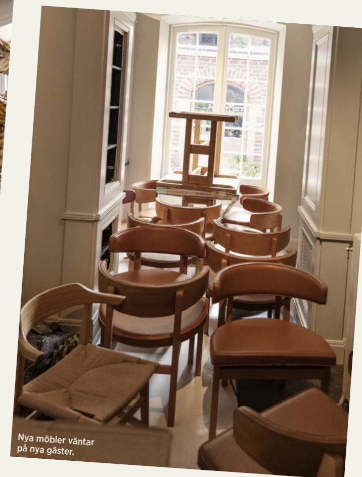
Nya möbler väntar på nya gäster.