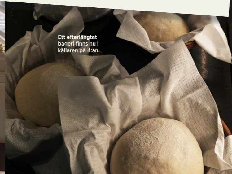
Ett efterlängtat bageri finns nu i källaren på 4:an.