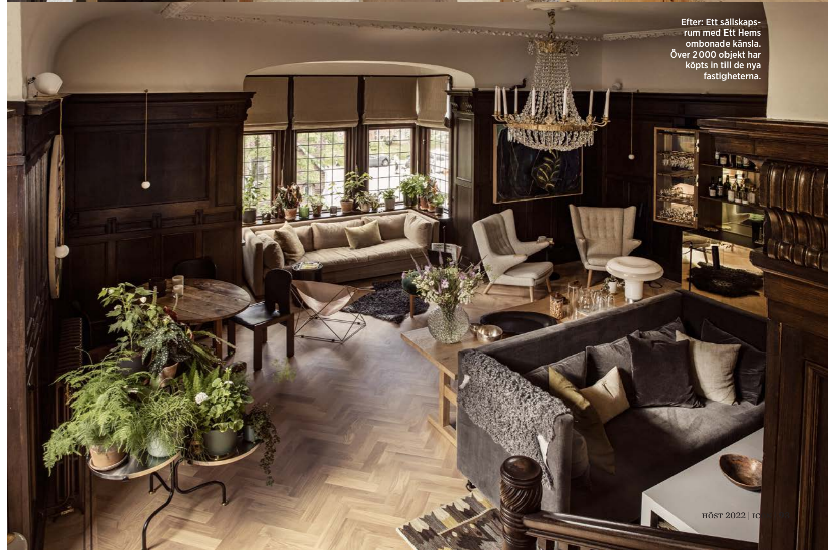
Efter: Ett sällskapsrum med Ett Hems ombonade känsla. Över 2 000 objekt har köpts in till de nya fastigheterna.