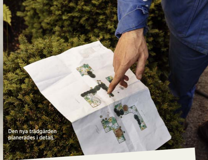
Den nya trädgården planerades i detalj.