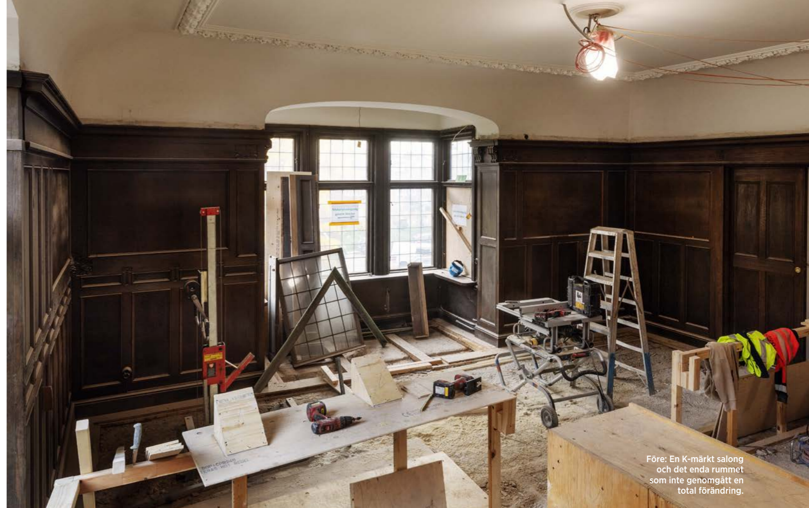
Före: En K-märkt salong och det enda rummet som inte genomgått en total förändring.

Amy Conneely, som är ansvarig för Studioilses arbete med hus 4 och 6, är på plats med två kollegor och Ilse Crawford ▶