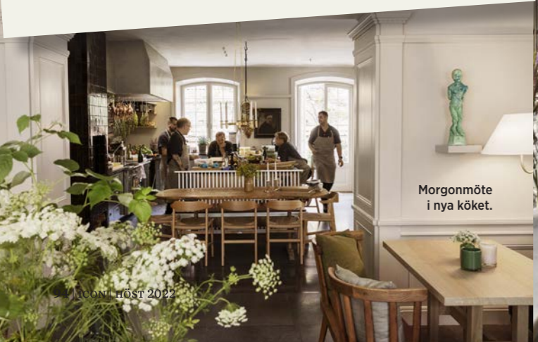
Morgonmöte i nya köket.