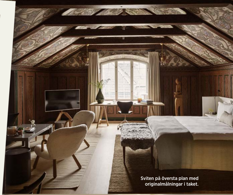
Sviten på översta plan med originalmålningar i taket.