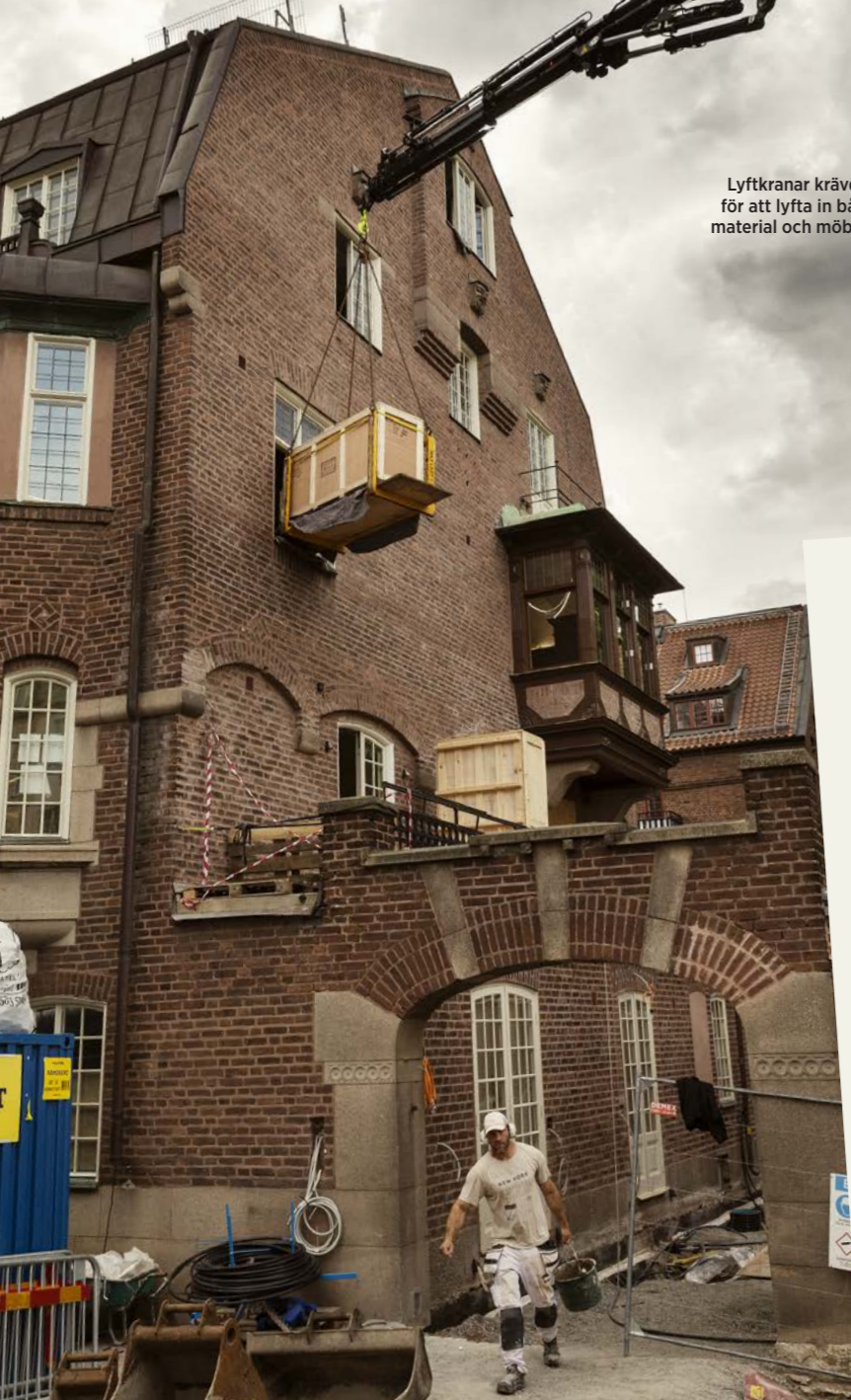
Lyftkranar krävdes för att lyfta in både material och möbler.