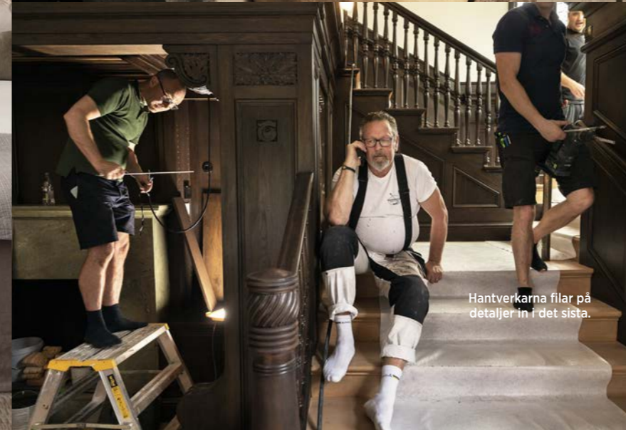
Hantverkarna filar på detaljer in i det sista.