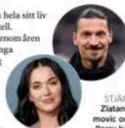
STjärNTÄTT. Zlatan Ibrahimovic och Katy Perry har båda bott på Ett hem.

Det skulle ta sex långa år innan Ett hem slog upp portarna i maj 2012. Men när väl hotellet öppnats var succén omedelbar, i alla fall sett till hur uppmärksamhet Ett hem blev i rese- och inredningsmagasinet från hela världen. Genom åren har Ett hem figurerat på flera listor över världens bästa